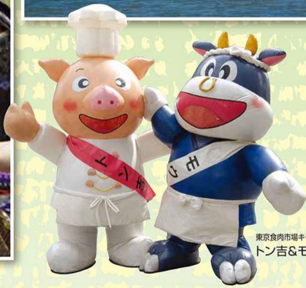
東京食肉市場キャラクター トン吉&モウ太