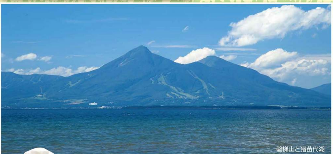
磐梯山と猪苗代湖